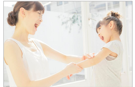
お子様と一緒に脱毛するお母様もどんどん増えてきています

学校の体育授業で体操着になるときや、バレエやスイミングなどの習い事でレオタードや水着になるときにムダ毛を気にしている子供が実は多いようです。また、お友達に「腕から糸が出ていよ」とからかわれたり、ムダ毛が原因で“いじめ”に発展するといった問題も実際にあるようです。小学・中学のムダ毛が生え始める時期にいる子供は、特にムダ毛に対する抵抗感が強く、恥ずかしいと感じているようです。中学校保健体育でのダンス授業必修化などからも、さらに低年齢層からの脱毛ニーズは高まることが予想されます。