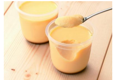
契約農場うみたて卵の無添加プリン