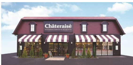
シャトレーゼ店舗イメージ

うれしい特典③アイスボールつかみ取り・・・小学生以下のお子様限定でアイスのつかみ取り！(フェア中毎日先着100名様)