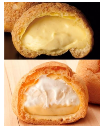
上:ピュアメルテ 下:ダブルシュークリーム