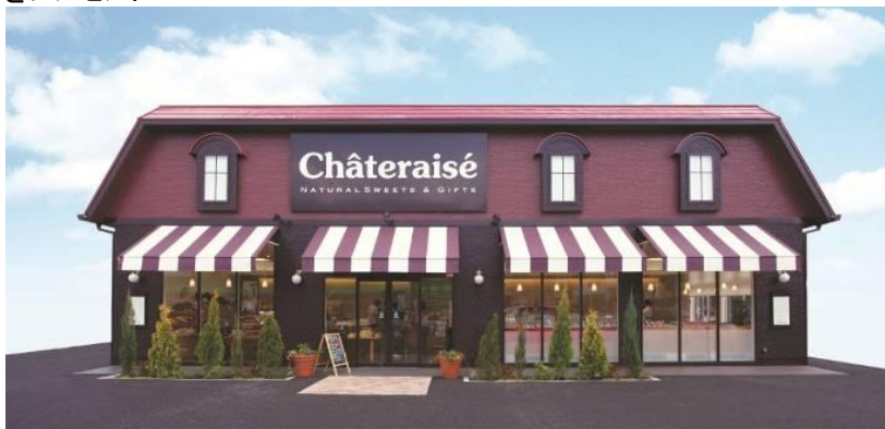
シャトレゼ店舗イメージ

フェア開催中に500円以上お買い上げのお客様に、もれなくシュークリーム2個(ダブルシュークリーム1個、ピュアメルテ1個)をプレゼント！