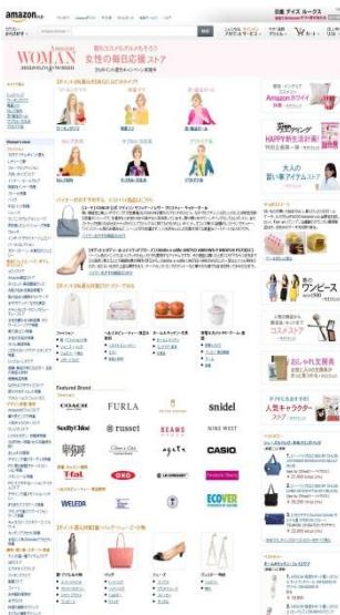
【Amazon Woman PCトップページ】