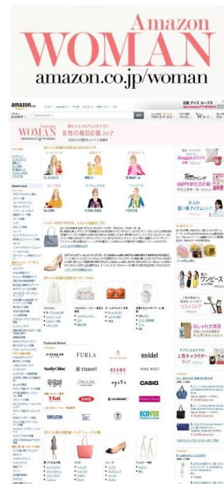
【Amazon Woman PC トップページ】