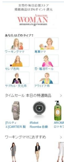
【Amazon Woman Mobileトップページ】