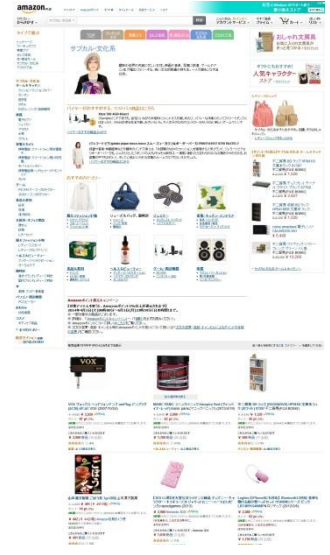
【サブカル・文化系トップページ】