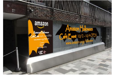
『Amazon Halloween Café』 ウィンドウディスプレイ イメージ