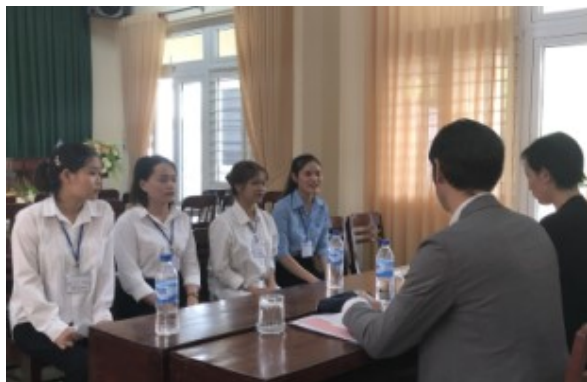
クアンガイ省 医療短期大学（国立）での面接会。