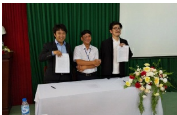
クアンガイ省ダンティラム医療短期大学（国立）と介護教育の業務提携。