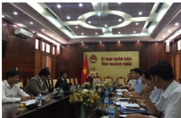
20190620 クアンガイ省副県長との対談

での人材紹介、入国前後の支援を一元管理し、ワンストップサービスで提供できるスキームを完成させました。