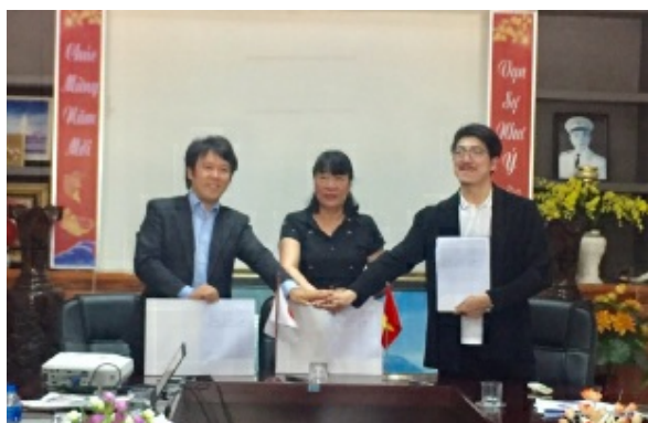
クアンガイ省クアンガイ医療短期大学（私立）と介護教育の業務提携。