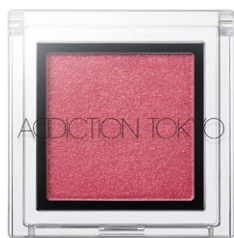
153 Pure Ruby