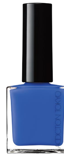
083S Jodhpur Blue