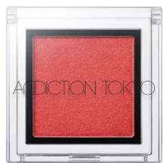
152 Saffron Red