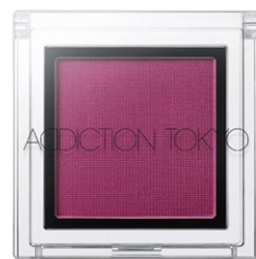
157 Viola Indica