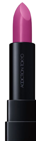
005 Viola Mist 淡く美しいパープル