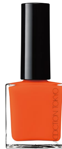
082S Sunny Marigold