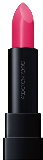
001 Sunny Pink ネオンに輝くシアーピンク