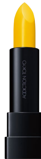
004 Amaltas Yellow 眩しく照らすシアーイエロー