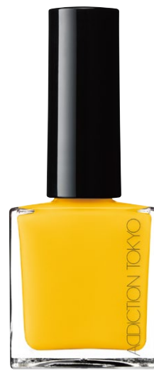
080S Amaltas Yellow