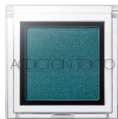
159 Vishnu Blue