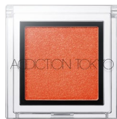
158 Orange Marigold