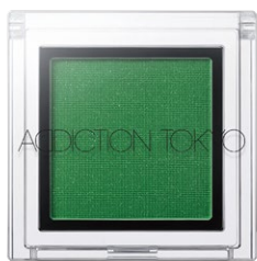
155 New Forest