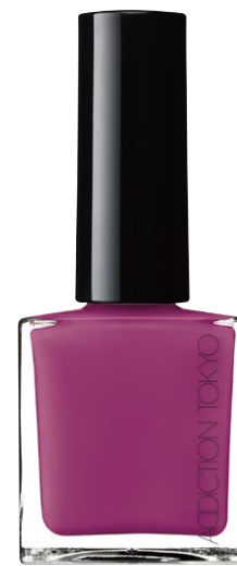
081S Viola Mist