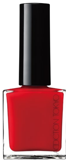
078S Breathing Fire