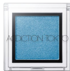
156 The Blue City