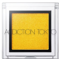
154 Amaltas Yellow