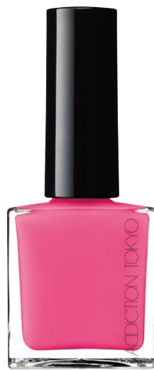
079S Sunny Pink