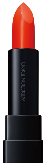
002 Sunny Marigold 満開に咲き誇る花のような シアーオレンジ