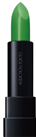
003 Tulsi Green 葉の上に光る雫のような シアーグリーン