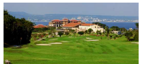
喜瀬カントリークラブ イメージ