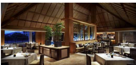
ダイニング グスク イメージ

「ザ・リッツ・カールトン沖縄」は、琉球のシンボルとなっている“首里城”の赤瓦と白い城壁、また古来より“聖地”とされ崇められてきた水の湧き出る場所をモチーフとしています。琉球でいう城とは、訪れる人を温かく迎え入れる場所を指し、「城（グスク）」と呼ばれます。古くより礼を重んじ礼を守ってきた琉球の人々が大切にしてきたおもてなしの心「迎恩（ケイオン）」の精神を具現化した「城（グスク）」で、お客様をお迎えいたします。