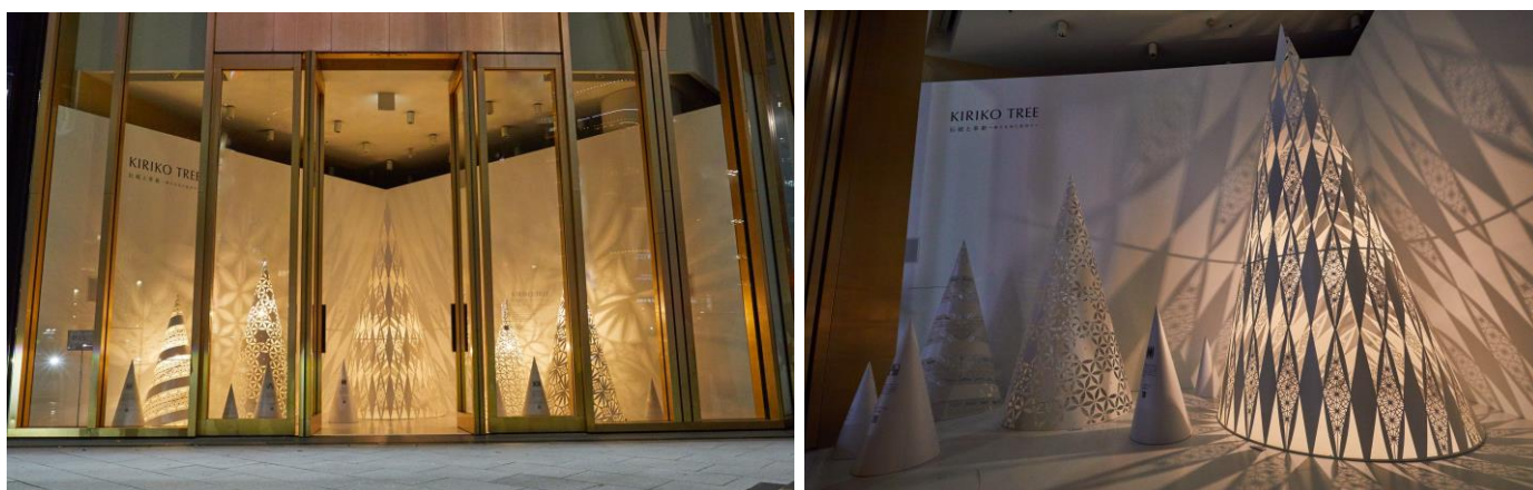
「KIRIKO LIGHTS CHRISTMAS 伝統と革新 ～新たな光に出会う～」

今回、Demold が持つ微細加工技術をふんだんに用い、江戸切子職人たちによる切子柄のデザインを金属薄板で表現したクリスマスツリーを制作いたしました。金属薄板加工に関して、豊富な経験と知識を有するからこそ発揮できる判断力と技術を駆使し、お客様がイメージしていた「繊細」と「ダイナミック」さが融合する作品へと迅速に仕上げることができました。本作品は、日本の伝統工芸品が持つ繊細さを、独自の技術を用い金属で表現してきた Demold だからこそ実現できた好例となります。