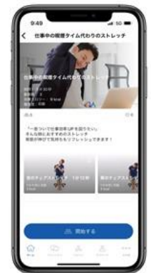
左：卒煙応援プログラム実施の流れ 右：WEBGYM メニュー例