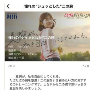
左：夏腕ステッカー 中：ほぐしローラーBody 右：WEBGYM メニュー画面