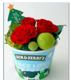
オリジナル プリザーブドフラワー

BEN&JERRY'Sのアイスクリームと共に、今年のクリスマスをお楽しみください。