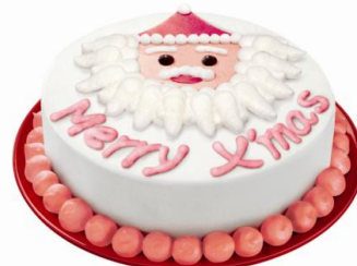
クリスマス・アイスクリームケーキ

また、「クリスマス・アイスクリームケーキ」を予約して頂いた方には、BEN&JERRY'Sからのクリスマスプレゼントとして、お馴染みのBEN&JERRY'Sのカップに、赤いバラと緑のツリー型メッセージカードをアレンジした「オリジナルプリザーブドフラワー」をもれなくプレゼントします。