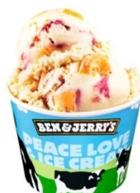
ピーチ パーティー

ピーチの果肉をふんだんに使ったフレーバーで、桃のフレッシュな香りと、隠し味のラズベリーソースのさわやかな香りがお口いっぱいに広がります。