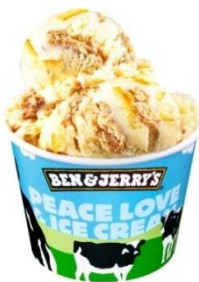
ユス シトラス キス

ミルクたっぷりのアイスクリームに、柚子のピールと風味豊かなバタークッキーのチャンクがたっぷり。