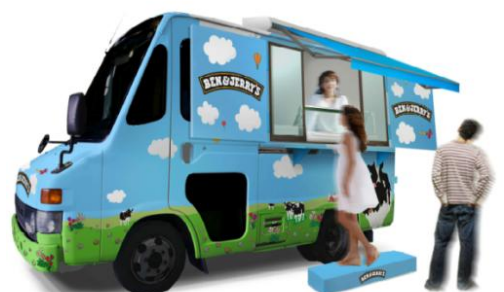
移動式店舗“COWCAR”デザイン