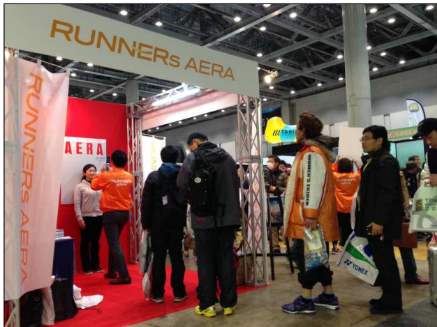
東京マラソンEXPO2014では、長蛇の列に。

ブースでは、『AERA』2014年10月11日発売号にて掲載された、最新ランニンググッズが一覧できる特別企画「RUNNERs AERA」の冊子を無料配布するほか、「東京マラソン EXPO2014」で大変ご好評いただいた「あなたも『AERA』の表紙に！」企画を実施します(無料)。これは『AERA』表紙パネルの前でスマートフォン等で撮影いただける“なりきりAERA表紙撮影企画”で、東京マラソンEXPOでは、多くのランナーの皆様にご参加いただき、話題になりました。