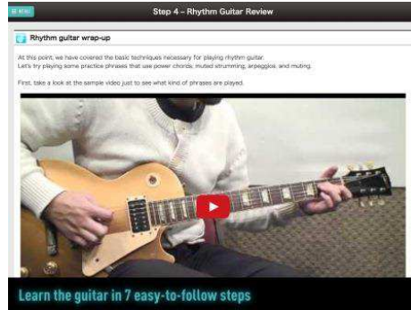
ギターレッスンムービークリップ