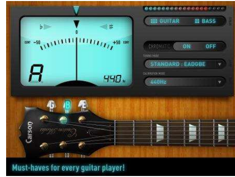
チューニング画面