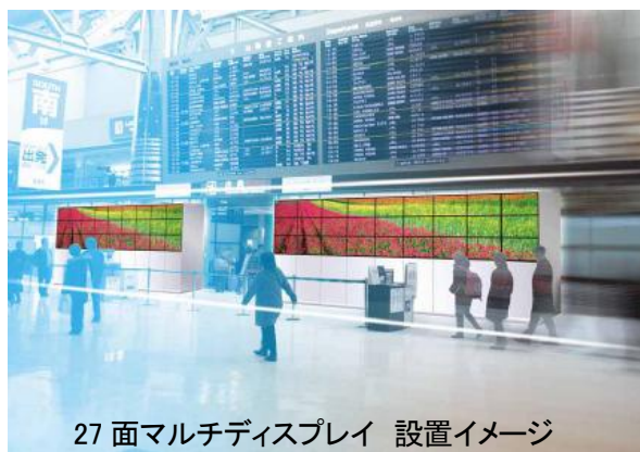
27面マルチディスプレイ 設置イメージ