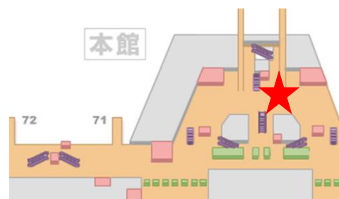
第2旅客ターミナルビル制限エリア2階イベントスペース