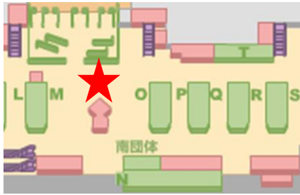
第2旅客ターミナルビル3階 出発ロビー南側スカイリウム