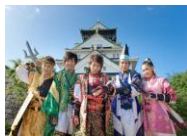
大坂RONIN 5 (大坂の陣400年天下一祭 大阪府・大阪市)