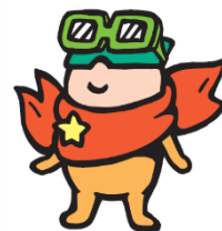
▲成田国際空港 マスコットキャラクター