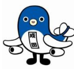
うなりくん (成田市)