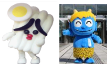
さぬどん・ 親切な青鬼くん (香川県)