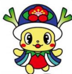
よこぴー (横芝光町)