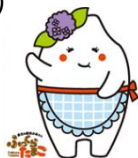
ふくらたまこ (多古町)