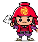
ふくおか官兵衛くん (福岡県)