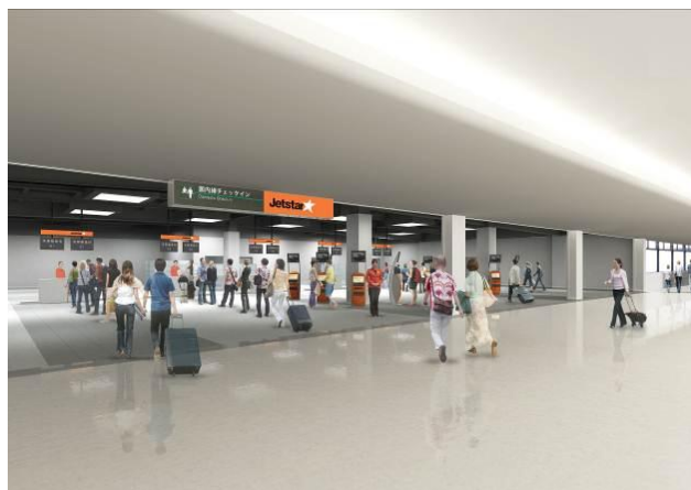
写真：2階チェックイン付近（イメージ）