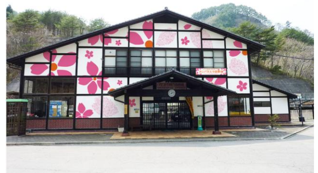
「キット、ずっとカンパネルラ田野畑駅」 ※画像はイメージです。