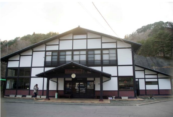
現在の写真:「カンパネルラ田野畑駅」