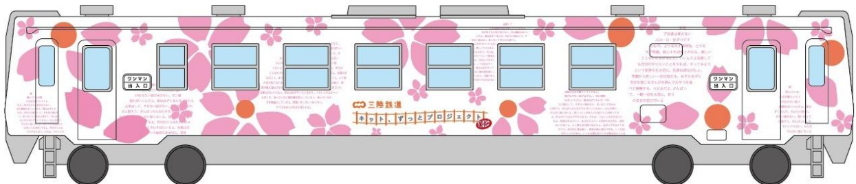
「キット、ずっと号」車両デザイン ※画像はイメージです。

また、この「キット、ずっと号」は、「キットカット キット、ずっと号」として商品化され、外装のデザインを使った特性キットカットが2012年3月30日(金)より弊社、並びにネスレのオンラインショップで予約販売を開始する予定です。