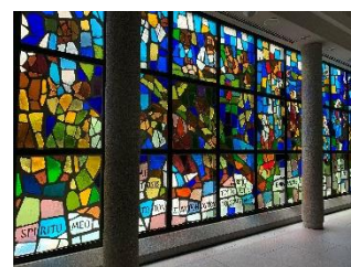
霊南坂教会 チャペルコンサート 10月6日(水)12:30～12:55

※各コンサートプログラムの詳細および申し込み方法は 公式サイト からご確認ください。