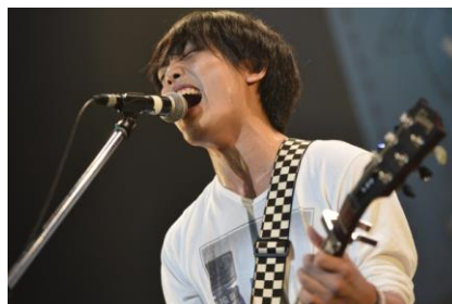
▲審査員特別賞「Strangers」(宮城県)