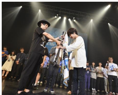
▲優勝した「Shout it Out」

この模様は、9月1日(火)、2日(水)の「SCHOOL OF LOCK!」(22:00~23:55 全国38局)でオンエア致します。