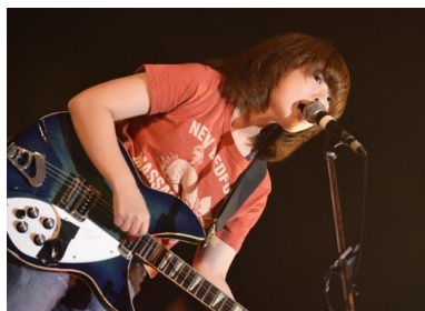
▲準グランプリ「リーガルリリー」(東京都)