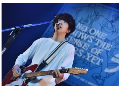
▲グランプリ「Shout it Out」(大阪府)

閃光ライオットの時代を含めて、今回が 3 回目の挑戦となった「Shout it Out」、ライブ終了後は「2 年間、積み重ねてきた思いをすべて吐き出しました」とコメント。受賞後のウィニングライブでは「これから歌う曲は、未来に向けて歌います」と、エントリー楽曲「17 歳」を力強く披露し、「未確認フェスを背負っていけるバンドになりたい」と決意を新たにしました。「Shout it Out」には優勝賞金として 100 万円と優勝旗が贈られました。