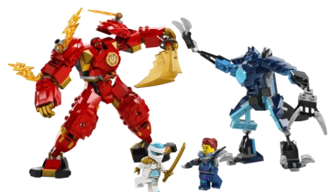
カイのエレメントパワー・メカスーツ 71808