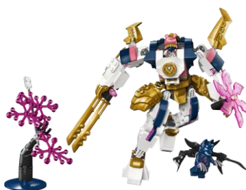
ソラのエレメントパワー・メカスーツ 71807