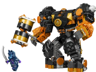
コアのエレメントパワー・メカスーツ 71806