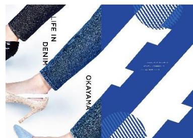
LIFE IN DENIM OKAYAMA ポスター-2019年7月掲出