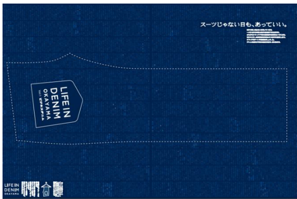
新聞30段 ジーンズ型ポスター 2019年5月6日掲載

仕事の生産性向上が求められる今だからこそ、服装にだって働き方改革を取り入れることが出来るはず。LIFE IN DENIM OKAYAMAのプロジェクト第一弾は、「オフィスウェアにデニムを取り入れてみませんか」という提案です。カジュアルな服装で仕事をする、オフィスの緊張がほぐれ、一人ひとりの個性と能力を発揮しやすくなると言われています。毎日は難しくても、たまにはスーツじゃない日を作ってみようと、岡山から日本全国へ発信していきます。