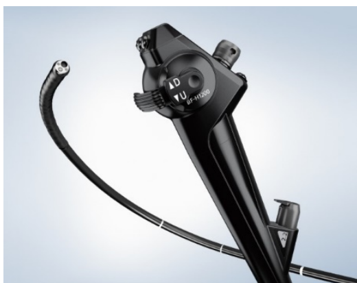
気管支ビデオスコープ OLYMPUS BF-H1200