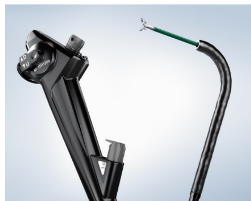
気管支ビデオスコープ OLYMPUS BF-1TH1200