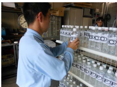
流通・物流技能検定（運搬・陳列）イメージ