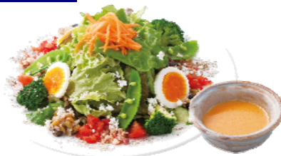
「京丹後の有機人参」を使った 「有機人参のドレッシングで食べる 17品目の彩り春サラダ」