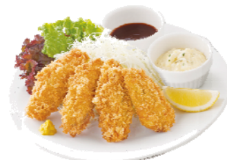
「牡蠣」を使った 「手仕込 カキフライ」