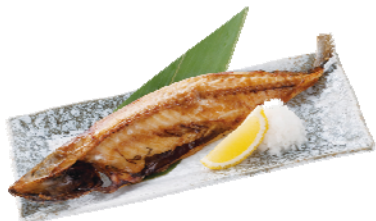
「サバ」を使った 「宮城県産 サバの塩焼き」