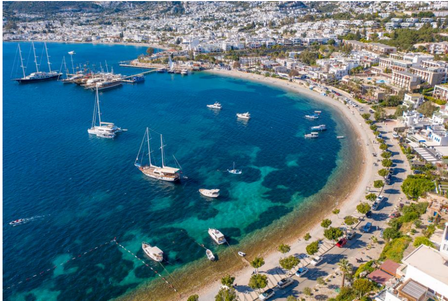
エーゲ海地方 ボドルム

トルコのエーゲ海地方では、何世紀にもわたる伝統的な食文化を取り入れた、独自の美食体験を提供しています。この地方は持続可能な食の点で、国内で最も重要な場所の一つに挙げられており、美味しいオリーブオイル、様々な地元産のハーブや野菜、新鮮な魚介類、古くからのワイン造りの伝統、ファーム・トゥ・テーブル（農家から食卓へ）の哲学などの食の伝統を受け継いでいます。