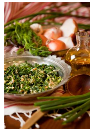
ハーブとオリーブオイルを たっぷり使用した料理

恵まれた気候と地理的条件から、エーゲ海沿岸はアナトリアでも有数のオリーブ生産地としてよく知られています。エーゲ海料理がオリーブとオリーブオイルを中心に形作られている理由も、この深く根付いた文化と栽培の歴史によるものです。この地域の美味しいオリーブとオリーブオイルは、昔からエーゲ海料理の中心的存在で、朝食にタイム、ローズマリー、ミントなどのハーブで香りづけされたオリーブオイルを焼きたてのパンにつけて食べたり、ランチやディナー時にサラダ、前菜、メインディッシュにオリーブオイルを使って、料理に風味とヘルシーさ、軽やかさを加えています。また、インゲン豆、ナス、アーティチョークなど春の訪れを告げる野菜が、長生きの秘訣であるオリーブオイルによって、素晴らしい一品に変身します。