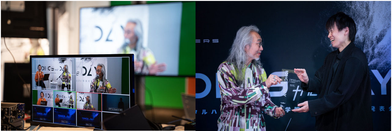
< 昨年の成果発表会開催風景 >

入学をご検討の方から、投資案件をお探しの企業様、起業仲間をお探しの方、ご興味のある一般の方まで、広く皆様のご視聴をお待ちしております。