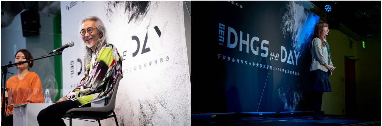
< 昨年の成果発表会開催風景 >

た、「修了課題プレゼンテーション」においては、特に優れた成果に対して最大 100 万円の事業化支援金によるサポートも行います。