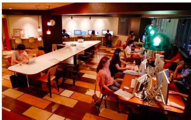
カフェ風なおしゃれな空間で自分のお気に入りのデスクに座りながら好きな時間に自由に学べる (写真左:デジタルハリウッド STUDIO 小倉、右:デジタルハリウッド STUDIO 新宿)