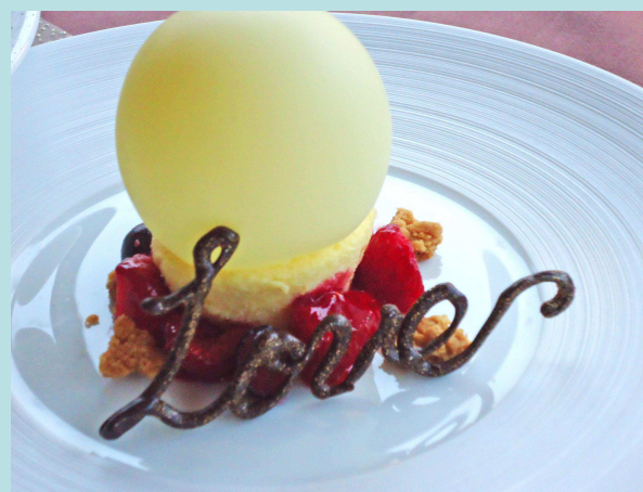
<デザートイメージ>