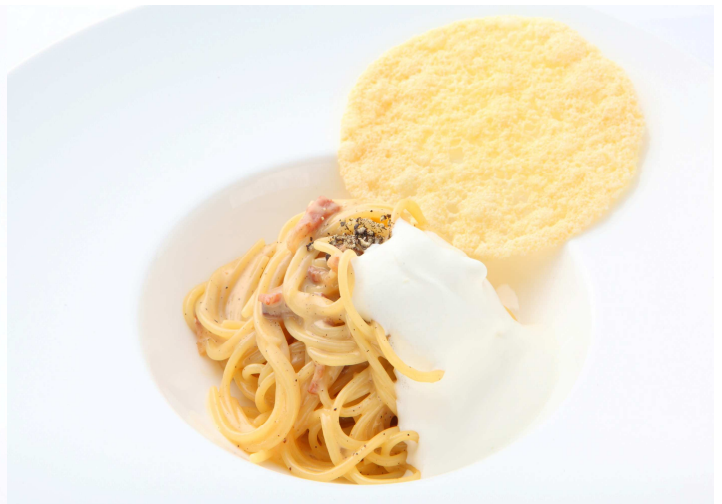
▲【パスタ】ペコリーノローマーノのカルボナーラ 豆乳クリームのエスプーマ