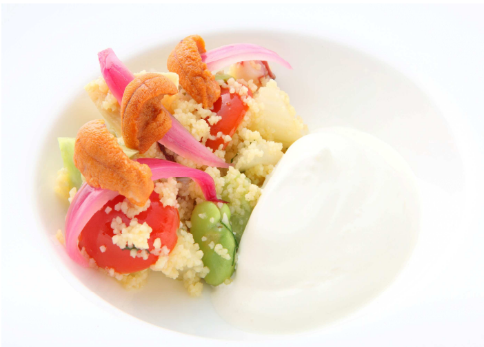
▲【前菜】魚介と豆乳クスクスのサラダ仕立て