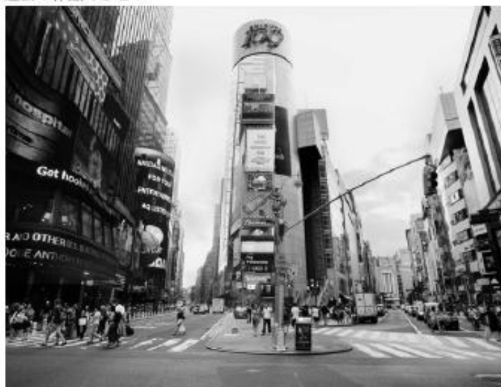
Times Square, 109 (2010) [ニューヨーク、東京]