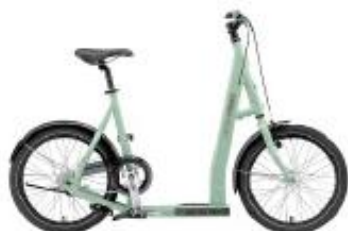
LOUIS GARNEAU SHUREE L