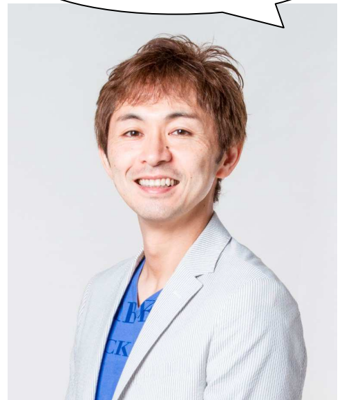
著者：志田 晶(しだ あきら)