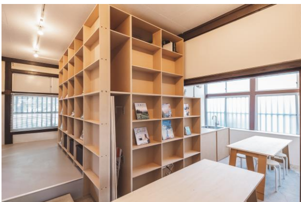
「沿線まるごとラボ」の内観