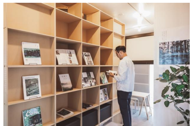
「沿線まるごとラボ」の内観