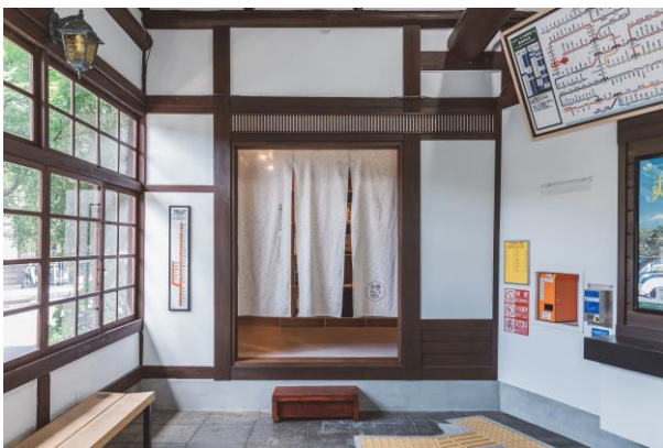
「沿線まるごとラボ」の入り口