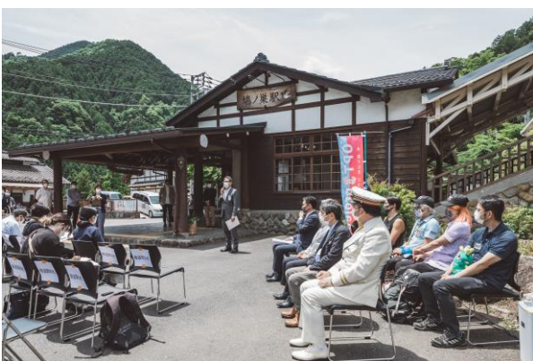
「沿線まるごとラボ」オープニングセレモニーの様子