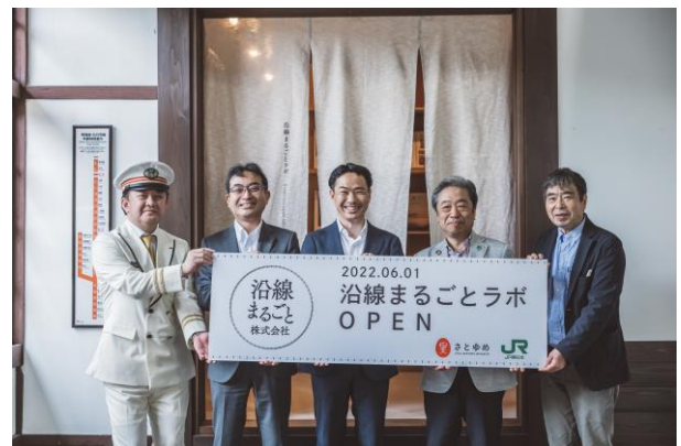
「沿線まるごとラボ」前での集合写真