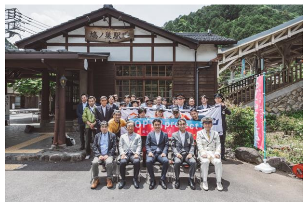
「沿線まるごとラボ」オープニングセレモニーの様子