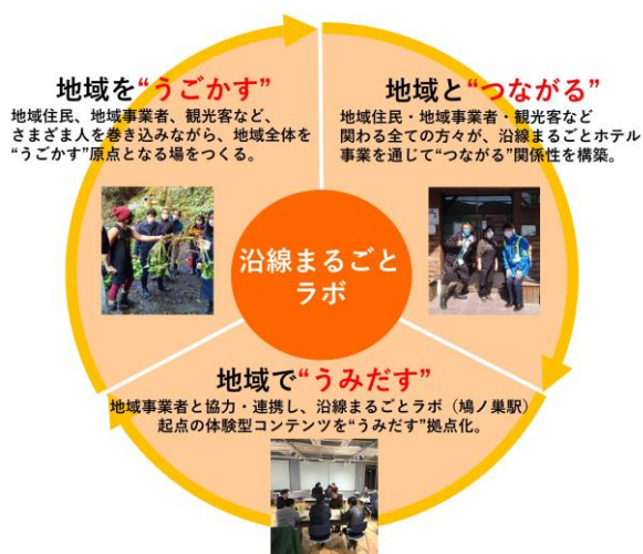
「沿線まるごとラボ」の3つの機能