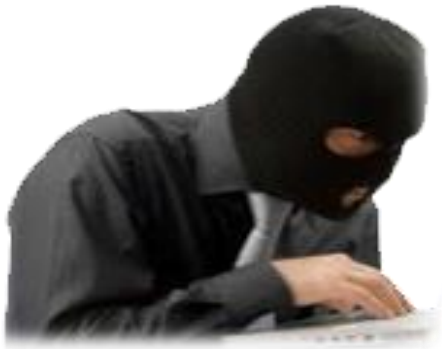
クラッキング行為

車載機にシステナの Web Shelter® を搭載した車載向けセキュリティソリューションをご紹介します。カーナビや AV 機器等において近年 Android® や組み込み Linux® 等のオープンプラットフォームの採用が進んできております。このことから一般的な IT 機器（PC やスマートフォン等）と同様の脅威、脆弱性が存在する可能性が十分に考えられます。システナは、全ての脅威、脆弱性に対応し、セキュアなカーライフを実現できるソリューションをご覧ください。