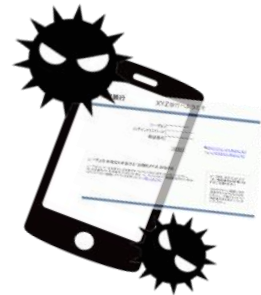
不正アプリ・不正コンテンツ