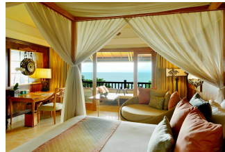
海を正面に臨むクラブルーム(イメージ)