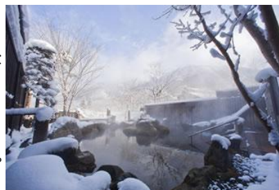
▲雪見露天風呂・奥飛騨温泉(イメージ)

今後も H.I.S.はキャンペーンを通じて様々な観点からお客様の声に耳を傾け、お客様のご旅行がより快適で充実したものになるよう、情報のご提供に努めてまいります。