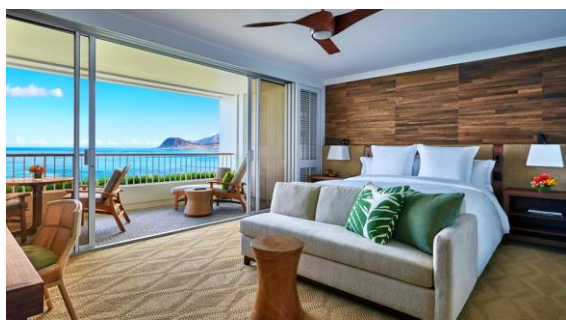
▲夏旅ホテル総選挙 2016 第 1 位：フォーシーズンズ リゾート オアフ アット コオリナ(イメージ)

【6/21～30 に新規オンライン予約される方限定】1 位を記念して特別割引クーポン登場！ 首都圏発着 ホノルル航空券と「フォーシーズンズ リゾート オアフ アット コオリナ」の同時オンライン予約で 1 万円引(1 グループ)！ クーポンコード：FSHT75P5JJZUGK38 詳細・予約はこちらから>> http://bit.ly/snshotel2016_his 【注意事項】※クーポンコードはホノルル航空券とフォーシーズンズ リゾート オアフ アット コオリナのセットでのご予約以外にはご利用できません。 ※オンライン予約画面のクーポンコードを入力する画面より上記クーポンコードをご入力ください。 ※割引対象は成田 or 羽田発着となります。 ※日本航空のみ適用外となります。 ※キャンセル時、キャンセルチャージへの充当は不可となります。 ※H.I.S.航空券 + ホテルサイトでのオンライン予約限定となります。 ※割引額は 1 グループあたりとなります。