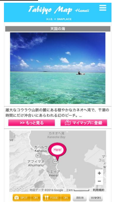
雄大なコウラウ山脈の麓にある穏やかなカネオヘ湾で、干潮の時間にだけ沖合いにあらわれる幻のビーチ...

今後、ハワイ旅行時に撮影された写真を、Instagram や Twitter で、ハッシュタグ「#tabijyomap_hawaii」にて募集し、集まった写真を H.I.S.各 SNS アカウントなどでご紹介させて頂きながら、更なるマップの充実化を目指します。素敵な写真は次号 12 月 1 日発行の次号「女子旅」ハワイパンフレットに掲載させて頂きます。