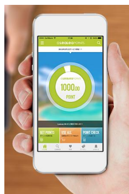
(LeaLea ポイントイメージ)

App Store、Google Playから「LeaLea ポイント」アプリをダウンロードしていただければ、どなたでもご利用いただけます。