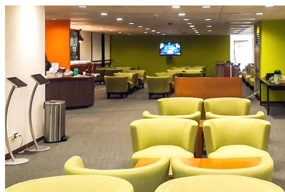
(LeaLea エアポートラウンジイメージ)