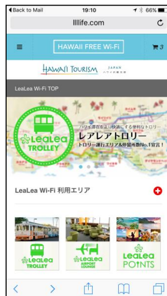
接続後 TOP 画面（イメージ）

「Hawaii Free Wi-Fi」は、約 20 秒の広告ムービーを視聴いただくことで、無料で1時間 Wi-Fi に接続が可能となります。「LeaLea Wi-Fi」においては、ユーザーが LeaLea ポイントアプリ（※1）をスマートフォンにダウンロードいただき接続用パスコードを取得することで、1週間の Wi-Fi 利用が可能となります。また、それぞれの Wi-Fi サイトからは、H.I.S.オリジナルサービス（LeaLea トrolley、LeaLea ポイントアプリ、LeaLea エアポート