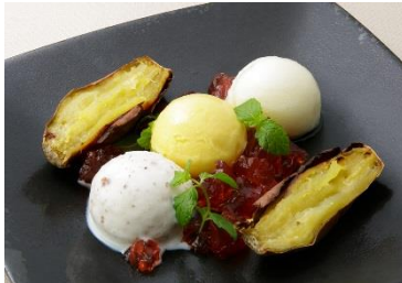
薩摩紅はるかの焼き芋と 徳之島ジェラートの盛合せ