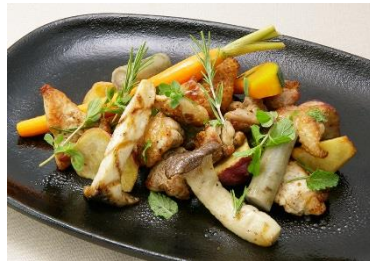
鹿児島県産黒さつま鶏の網焼 坂元醸造壺造り黒酢添え