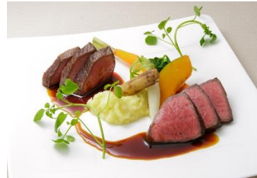
鹿児島県産黒毛和牛もも肉のステーキ 坂元醸造壺造り黒酢ソース