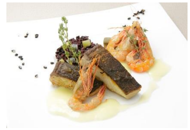
鹿児島県産のカンパチと薩摩赤えびのグリエ 芋焼酎バターソース黒もちリゾット添え