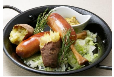
鹿児島県産黒豚の骨付きソーセージ 焼きさつま芋添え