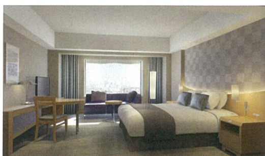
利休カラー (28・30階) 2フロア 46室

2014年9月に改装を実施し、客室の一部が日本の伝統色をテーマにしたお部屋に生まれ変わることとなりました。日本の風物詩を感じるプラン『月夜見～つくよみ 2014』はこのリニューアル客室にご案内。高層フロアからの夜景と日本の美意識を感じる秋の休日をゆったりとお過ごしくください。