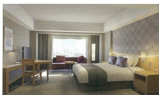
さくらカラー (29階) 1フロア 23室

“利休ねず”は粋(いき)を表すやや緑がかったグレー色。江戸時代から続く“東京の粋”をあらわす色として選択いたしました。日本ならではの粋なおもてなしを色調から感じていただきたいという願いをこめています。