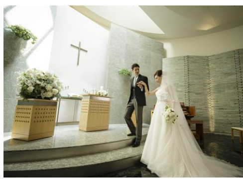
④教会式結婚式イメージ