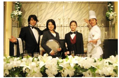
⑮-D サプライズオペライメージ