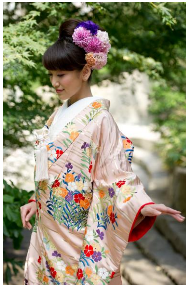
⑮-F 和装前撮りイメージ