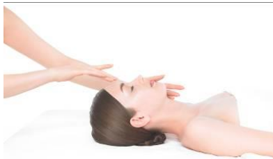
⑩エステティックイメージ