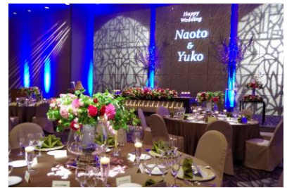
⑮-C オリジナルインプレッションイメージ