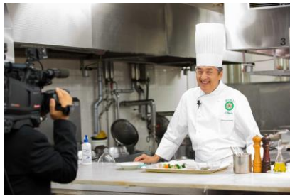
⑮-A キッチンライブイメージ