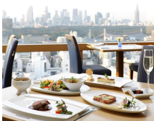
プリフィックスランチコース イメージ