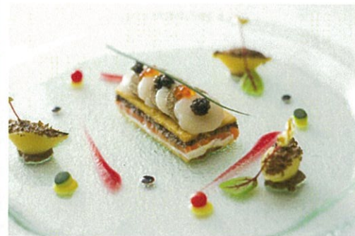
お料理の写真はイメージとなります