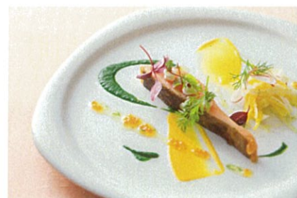
お料理の写真はイメージとなります