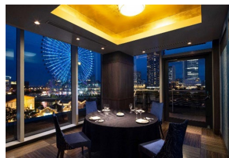
個室「天府」イメージ(ディナー)

〔お客さまのお問い合わせ先〕 横浜ベイホテル東急 レストラン予約(10:00～19:00) Phone: (045) 682-2255