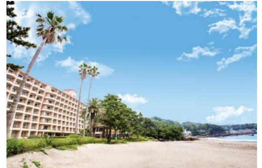
座禅体験をするホテル前の今井浜海岸