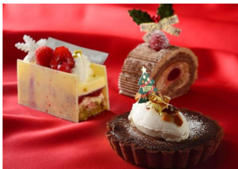
クリスマスミニケーキ