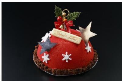
ノエル オ ショコラ