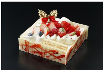
ガトー ド ノエル